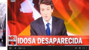
Bombeiros de Óbidos salvam idosa desaparecida