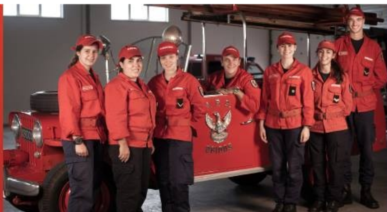
Design: M. Martins & C.ª

O Corpo de Bombeiros de Óbidos lançou, no passado dia 07 de dezembro, uma Campanha de apelo ao Voluntariado. A ADORO, uma empresa de Lisboa, constituída por duas amigas que trabalham, entre outras áreas em fotografia, e a CH Consulting – Monstros e Companhia, com sede em Coimbra, enquanto agência de Comunicação e Design, aceitaram o nosso desafio e embarcaram juntamente com a Juvebombeiro do Corpo de Bombeiros neste projeto de recrutamento de novos voluntários.